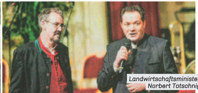
Landwirtschaftsminister Norbert Totschnig