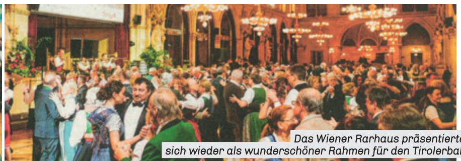
Das Wiener Rathaus präsentierte sich wieder als wunderschöner Rahmen für den Tirolerball